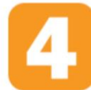
Afbeelding 1: Welkomstscherm P4F app